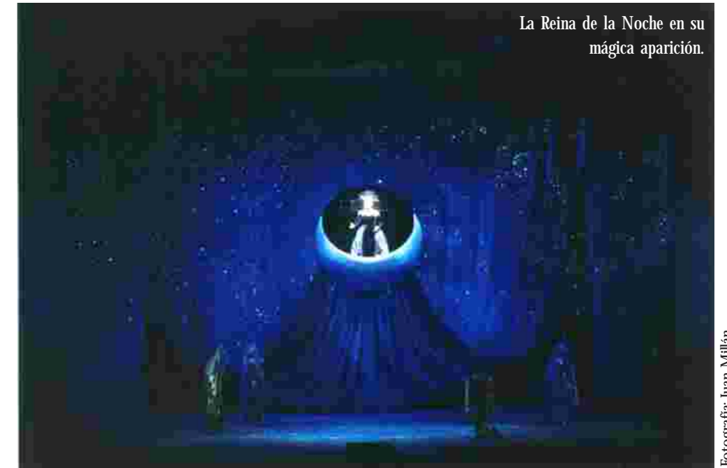
La Reina de la Noche en su mágica aparición.

Respecto al vestuario, fue diseñado en tonos